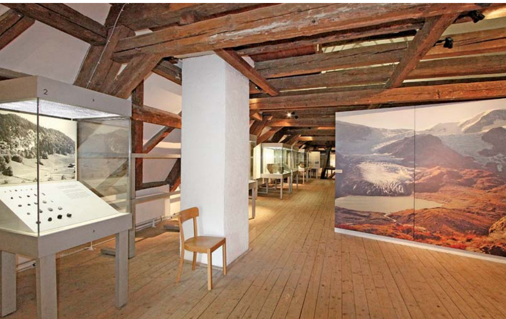
Schwerpunkte des Archäologiemuseums sind Besiedlungs- und Kulturgeschichte des südschwäbischen Raumes von der Eiszeit bis in das frühe Mittelalter