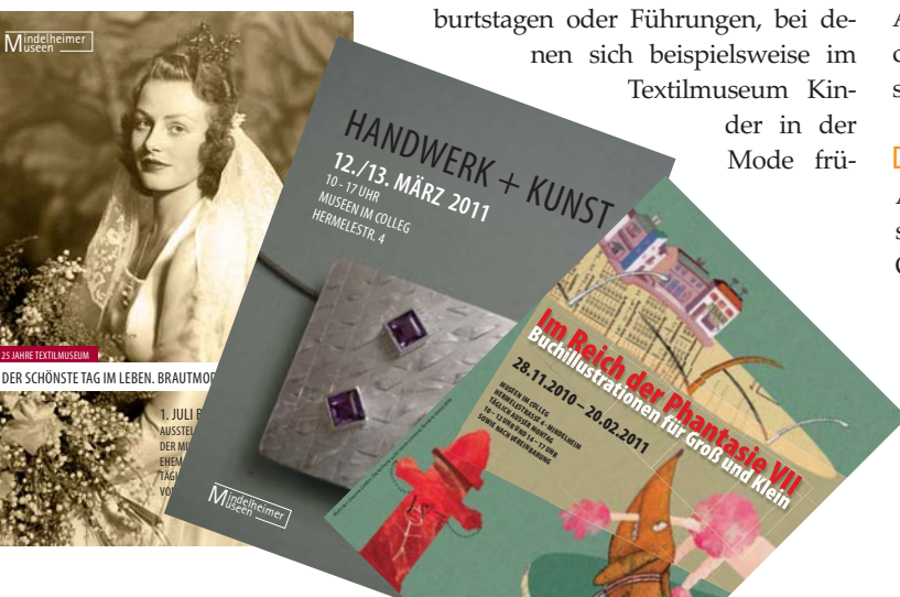
Aktuelle Ausstellungsflyer der fünf Museen

Aufgrund des geringen Budgets, das ihnen zur Verfügung steht, setzen die Museen neben Events stark auf Presse- und Öffentlichkeitsarbeit sowie auf Kooperationen mit den Schu-