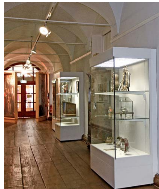
Das Krippenmuseum präsentiert die Bilderwelt um...