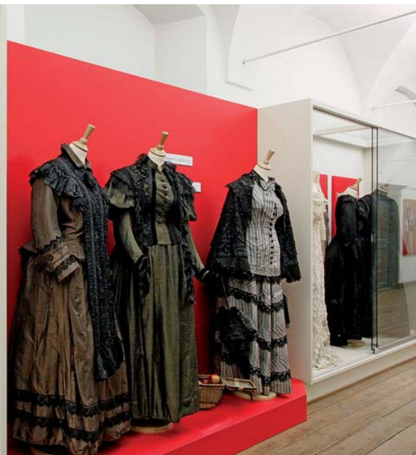
Das Textilmuseum feiert in diesem Jahr sein 25-jähriges Bestehen

einer reichhaltigen Sammlung die Geschichte der adeligen Stadtherren Mindelheims sowie die Geschichte der Stadt mit ihrer bürgerlichen Kultur und dem bäuerlichen Umfeld gezeigt. Ganz in der Nähe liegt das fünfte Museum: das Schwäbische Turmuhrenmuseum. Es ist in der ehemaligen Silvesterkirche und deren 48 Meter hohem Turm ansässig.