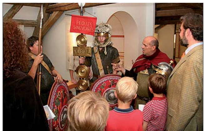
Für die jährliche Altstadt nacht organisieren die Museen ein umfangreiches Kulturprogramm

Die Museen werden sowohl von Einheimischen als auch von Menschen aus nah und fern besucht. Ein Blick ins Gästebuch beweist: Die Besucher kommen mitunter aus Hamburg, Gießen, Passau, Augsburg und München, um nur einige zu nennen. Ein wichtiges Einzugsgebiet ist der Baden-Württembergische Raum bis Stuttgart. "Die Museen sind aber nicht nur ein touristischer Anziehungspunkt, sondern auch eine wichtige Identifikation und ein Stück Heimat für unsere Bürgerinnen und Bürger", so Winter weiter. "Mindelheim versteht sich als Kulturstadt mit einem angesichts der Größe der Stadt erstaunlich breiten und vielseitigen kulturellen Angebot, das auch durch die Museen und deren Aktivitäten bereichert →