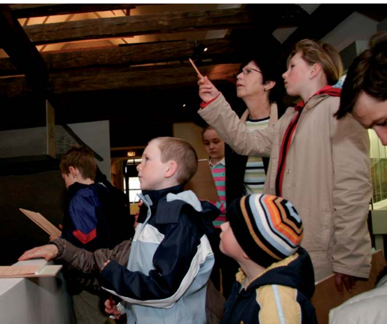
Am Familientag gibt es kostenlosen Eintritt in alle Museen und ein auf unterschiedliche Altersgruppen zugeschnittenes Programm

len oder ortsansässigen Wirtschaftspartnern. Zur alle zwei Jahre stattfindenden Ausstellung "Im Reich der Phantasie", die Buchillustrationen aus dem In- und Ausland zeigt, gestalten etwa die Buchhandlungen ihre Schaufenster entsprechend und halten die Bücher, aus denen die Illustrationen stammen, vorrätig.