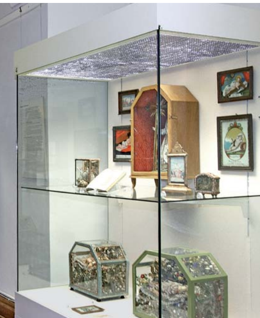
...Kindheit und Passion Jesu Christi