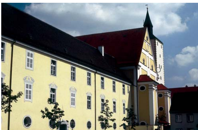
Drei der Museen sind in einem ehemaligen Jesuitenkolleg untergebracht

Ebenfalls in einem Kloster und nur einige Straßen entfernt, ist das Heimatmuseum untergebracht. In den barocken Räumen des Franziskanerinnenklosters Heilig Kreuz wird anhand